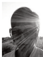
Nancy Newberry / Etats-Unis

Themba Mbuyisa (1992) a étudié à l'université de Witwatersrand et au market photo workshop. Son travail a été exposé en Afrique du Sud, au musée d'art de Pretoria ainsi qu'à Londres dans le cadre de l'exposition Sony World Photography Awards. Il a été publié dans Elle South Africa.